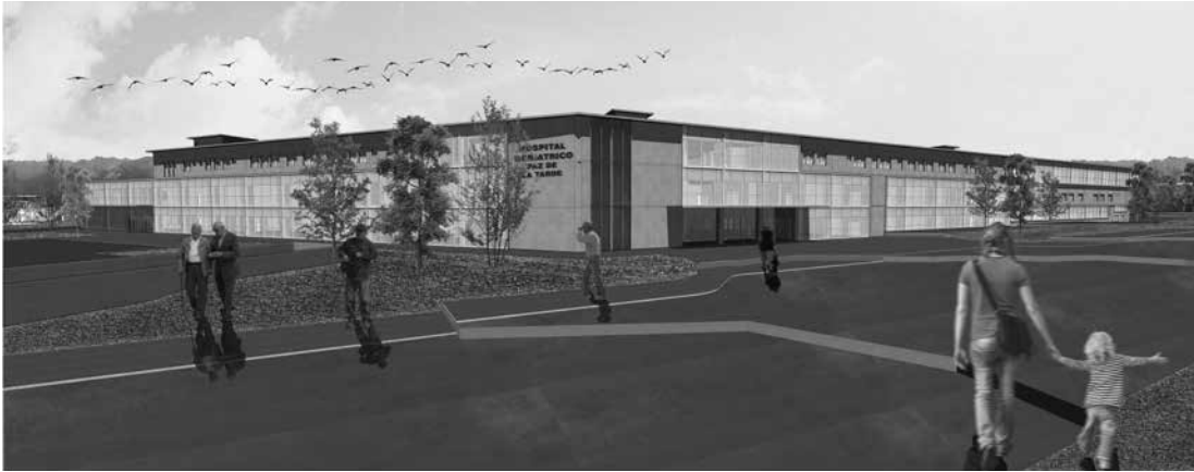
◀◀ (en la página anterior) Figura 1. Imagen Exterior. Estación de Bomberos de Linares. Taller de Proyectos Comunitarios. Estudiante: Héctor Olguín (2021).