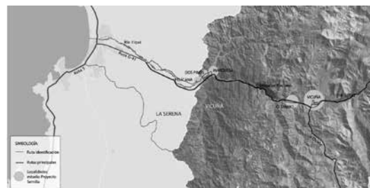
◀ Figura 3. Mapa barrido inicial de identificación.