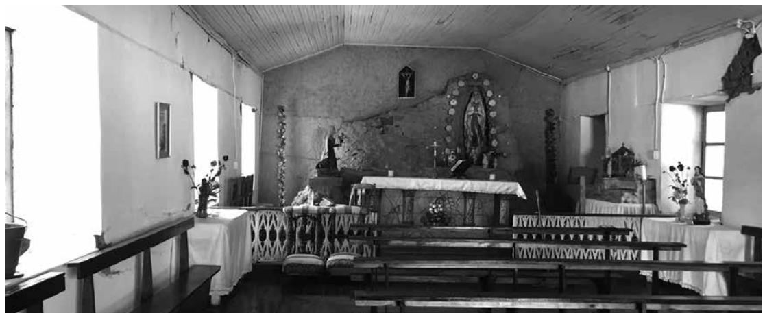
► Figura 5. Imagen interior capilla Dos Pinos.