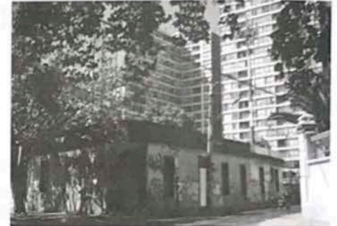
Imágenes N° 1 - 2 - El patrimonio arquitectónico de la comuna de Estación Central es vulnerable, debido a procesos de especulación inmobiliaria.