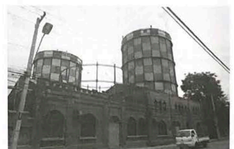
Imagen 6 - Patrimonio Industrial en la Comuna de Estación Central.