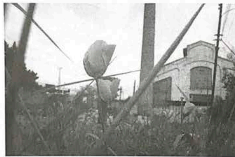
Imagen 3 - Patrimonio Industrial en la Comuna de Estación Central.

La actual política de protección patrimonial en Chile funciona a través de un proceso de selección caso a caso que protege bienes de excepcional valor. En este contexto, algunos bienes aún no identificados como patrimonio pueden ser excluidos del resguardo legal, a pesar de su antigüedad o interés histórico. Esta situación se verifica en la comuna de Estación Central. Dada la antigüedad y características de este territorio, es necesario aún reconocer gran parte del patrimonio heterogéneo y diverso aquí contenido, de gran capital social y cultural.