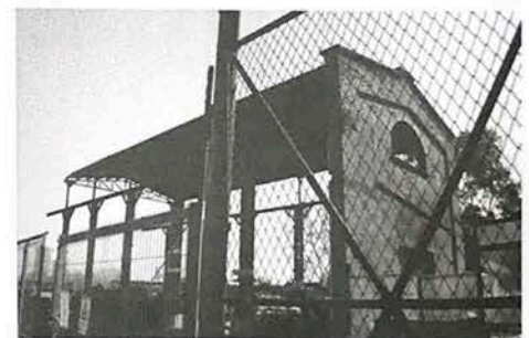
Imagen 4 - Patrimonio Industrial en la Comuna de Estación Central.