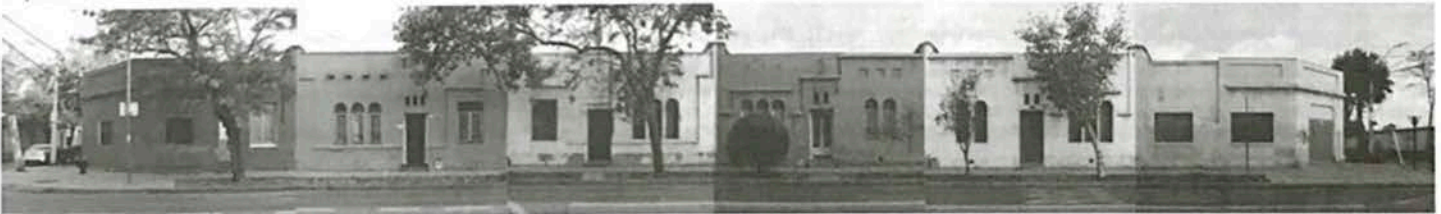
Imagen N° 8 - Población El Riel, conjunto habitacional de la primera mitad del siglo XX, perteneciente al sitio de patrimonio industrial de la Maestranza San Eugenio. En la actualidad no posee protección legal.