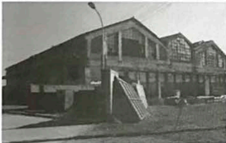
Imagen 7 - Patrimonio Industrial en la Comuna de Estación Central.

El actual estado de conservación del sitio industrial de la Maestranza es de avanzado deterioro, debido a la ausencia de mantenimiento periódica en las últimas décadas. Lo anterior contrasta con el adecuado estado de conservación en que se encuentra la Población El Riel, con viviendas aún habitadas y en uso. Dada la relación original con la maestranza de ferrocarriles, este conjunto debiese ser considerado parte del sitio industrial protegido.