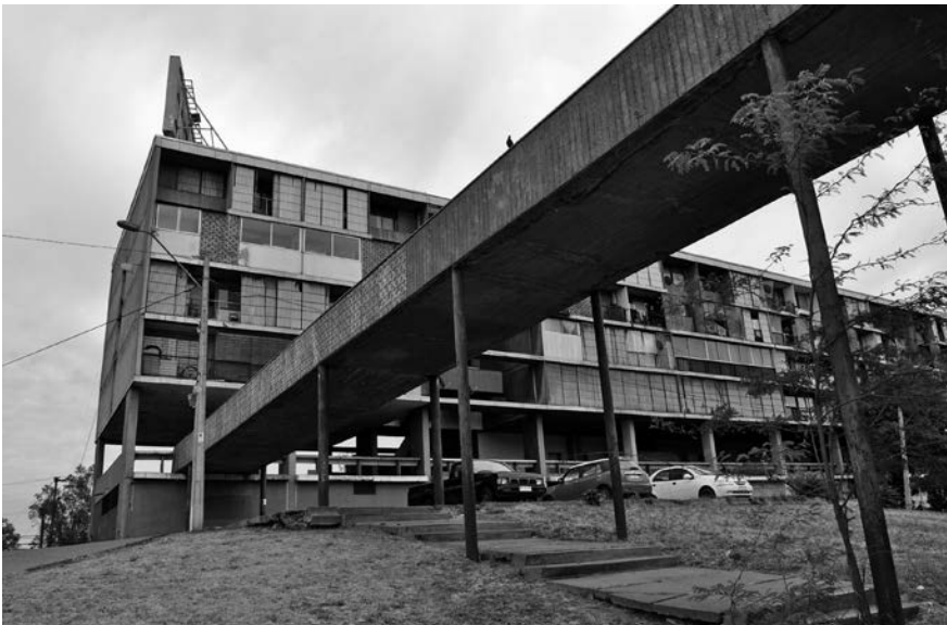
Imagen 5. Puente de acceso Unidad Vecinal Portales.