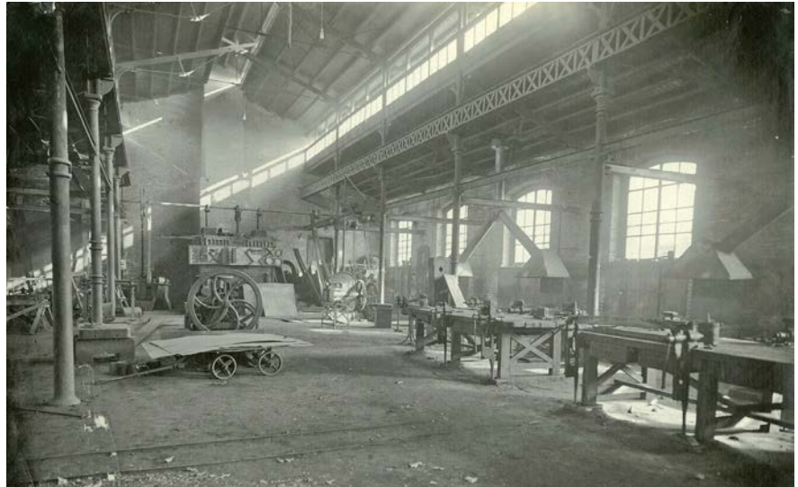
Imagen 1. Taller de Fundición. Escuela de Artes y Oficios, Santiago de Chile, ca. 1920 (fuente: Archivo de Documentación Gráfica y Audiovisual, Universidad de Santiago de Chile).