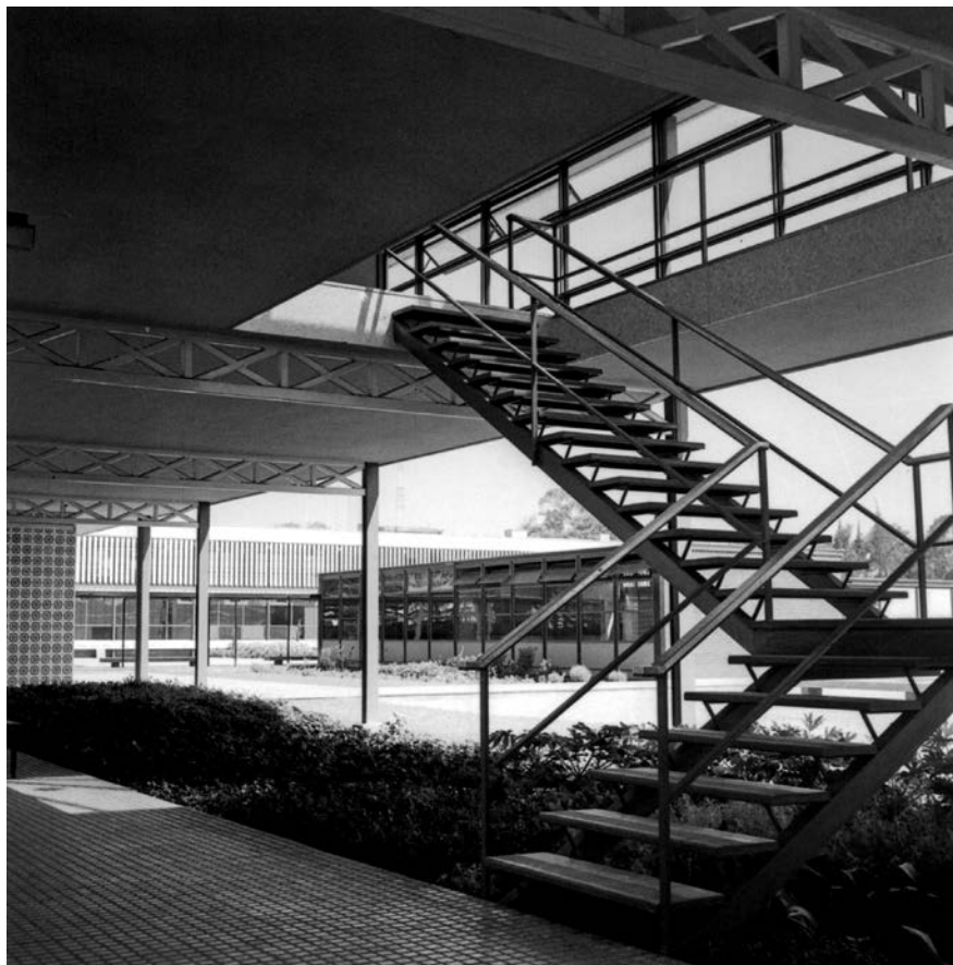
Imagen 6. Escalera de acceso al edificio Logias. Universidad Técnica del Estado, c. 1961 (fuente: Archivo de Documentación Gráfica y Audiovisual, Universidad de Santiago de Chile).

espacial, "... la percepción del espacio es sin duda un fenómeno complejo: percepción y representación del espacio están indisolublemente ligados. De este punto de vista, el espacio aparece como un doble diedro que cambia dimensiones y posiciones a cada instante: es un diedro de acción , cuyo plano horizontal está formado por el terreno y el plano vertical de la misma persona que camina y que, en virtud de esto, lleva el diedro con sí, y es un diedro de representación , determinado por el mismo plano horizontal que el anterior (pero representado, no percibido) intersectado verticalmente en el punto en que aparece el objeto" (Caillois, 1939). Ciertamente, un elemento fundamental en la arquitectura ha sido la constitución de los límites del espacio. En la arquitectura moderna los límites de los recintos y elementos se difuminan para dejar aparecer lo infamiliar que también poseen, como sucede con las palabras que, al sacarlas de su contexto habitual, se muestran en toda su extrañeza. En el espacio dislocado, el sujeto no sabe qué es lo que le pertenece,