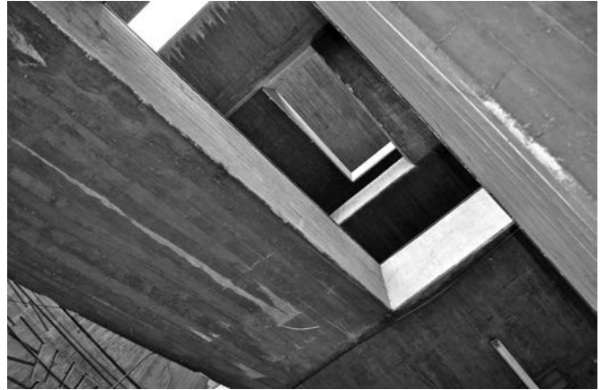
Imagen 8. Trama de vigas y losas, Unidad Vecinal Portales.

arriesgando perder la sensación que tiene de sí mismo. El sujeto pierde las referencias para ubicarse en el ambiente circundante, incluso puede confundir las orientaciones elementales, delante-atrás, arriba-abajo, izquierda-derecha. Baudelaire hablaba de la multitud como una masa anónima que se pierde en la ciudad. Jorge Luis Borges, en uno de sus cuentos, confina a dos de sus personajes en lo semejante, el desierto y el laberinto, para cumplir el mismo destino, el extravío. Poner en riesgo la conciencia