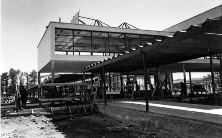
Imagen 4. Edificio Logias Unidad Universitaria Universidad Técnica del Estado, Santiago de Chile, ca. 1958 (fuente: Archivo de Documentación Gráfica y Audiovisual, Universidad de Santiago de Chile).

Pero es a Lázló Moholy-Nagy, artista y profesor de la Bauhaus, a quien se le puede atribuir mayor energía para promover los conceptos de movimiento, luz y de disolución de los cuerpos al formular la idea de espacio como puras relaciones . Para él, ya no es posible hablar de volúmenes. El avance técnico permite disociar sus componentes para crear tramas de elementos abiertos en la extensión. Una "función biológica" común a los seres humanos permite reconocer esas tramas . Es un "don natural que todos poseemos, como lo es la experiencia del color o del tono". La posición del cuerpo contribuye a la constitución de esas relaciones espaciales y su reconocimiento está dado por el sentido de la visión. "Esta experiencia de las relaciones visibles de los cuerpos puede ser examinada con el movimiento -por la modificación de nuestra posición- y por medio del tacto" (Moholy-Nagy, 2008). La experiencia ideal del espacio se produce en el movimiento y, "a un nivel superior, en la danza", ya que permite una articulación espacial dinámica. En otras palabras, el espacio surge como objeto estético y soporte de puras relaciones entre elementos activados por el movimiento y la visión. Esta concepción física le confiere una