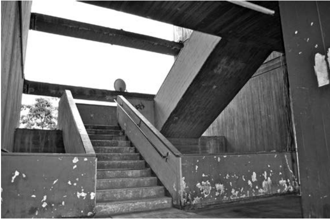
Imagen 7. Escalera de acceso Unidad Vecinal Portales.